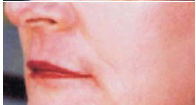
Hautstraffung vor und nach der Behandlung