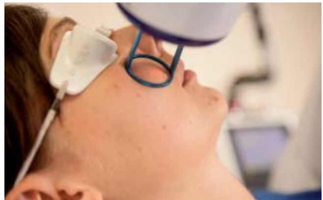
Behandlung mit dem Fractional CO 2 Laser