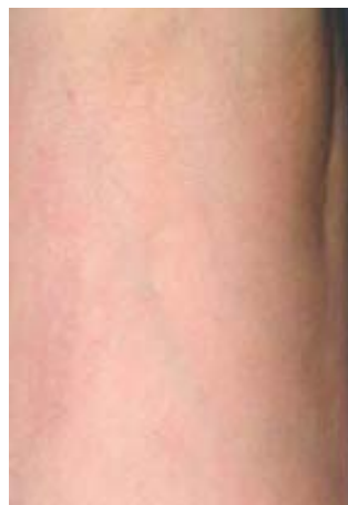
Besenreiser am Bein nach der Behandlung