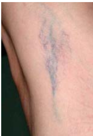
Besenreiser am Bein vor der Behandlung

Bei einer gewünschten Haarentfernung sollten Sie sechs Wochen vor der Behandlung auf Zupfen, Elektrolyse, Epilation oder Haarentfernung durch Wachs verzichten. Sollten Sie zu einem perioralem Herpes neigen und eine Gesichtsbehandlung wünschen, dann empfehlen wir eine prophylaktische antivirale Therapie. Alle Haare sollten durch Rasur vollständig entfernt werden. Die Haut muss gründlich gereinigt und trocken sein. Vor einer Laserbehandlung müssen also jegliches Make-up, Cremes und Öle entfernt sein. Ebenso sollten Sie keinen Selbstbräuner am Behandlungstag aufgetragen haben. Meiden Sie vor der Therapie Solariumbesuche oder intensiven Sonnenkontakt. Lassen Sie sich durch uns beraten, welche Medikamente eine Lichtsensibilität hervorrufen können und vor der Therapie abgesetzt werden sollten.