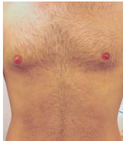
Bauch- und Brustbehaarung vor der Behandlung

Es ermöglicht dadurch praktisch die Durchführung aller gängigen ästhetischen Behandlungen, so zum Beispiel die dauerhafte Haarentfernung bei allen Hauttypen und sonnengebräunter Haut, die Entfernung gutartiger vaskulärer Läsionen (Besenreiser) oder Teleangiectasien.