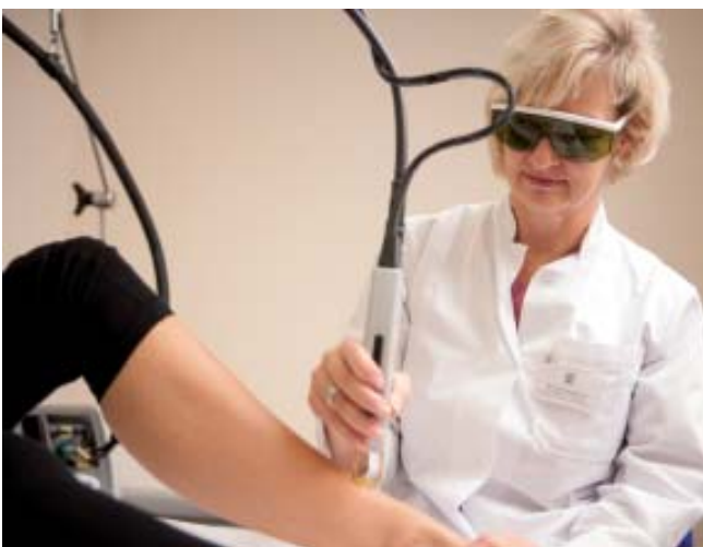
Behandlung mit dem Gentle YAG Laser

Wir freuen uns auf Ihren Besuch und danken der Firma Candela für die Weitergabe der Informationen aus diesem Flyer.