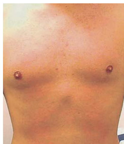
Bauch- und Brustbehaarung nach der Behandlung